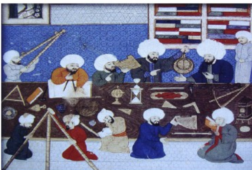
Taqi Al-Din et des astronomes dans son observatoire - Miniature anonyme 1581

Les marins apprirent des savants de l'Orient l'art d'observer les étoiles et rapportèrent des boussoles.