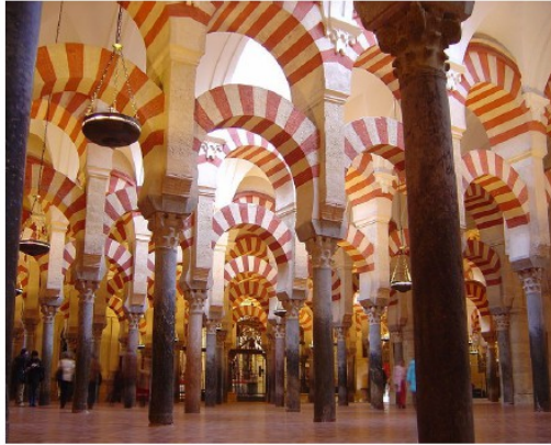
Mesquita de Cordoue, Espagne

Le jeu d'échecs fit son apparition en Occident. Les Arabes ont transmis aux Européens leurs propres découvertes (comme l' algèbre en mathématiques ) et celles acquises d'autres civilisations (le papier inventé par les Chinois, la médecine et la philosophie de la Grèce antique). L' art européen s'est beaucoup inspiré de l'art musulman (des églises construites sur le modèle de mosquée et l'art des beaux jardins). Enfin, le monde lointain fit naître tant de belles légendes ! (les contes des mille et une nuits...)