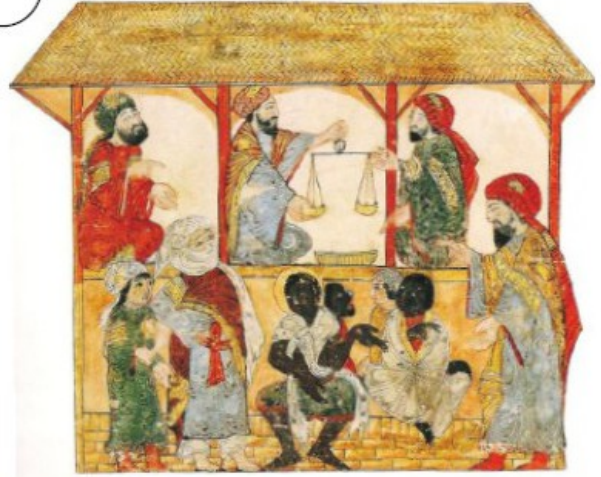
Des changeurs et des marchands d'esclaves, manuscrit de Bagdad, 1237.

Quatre esclaves sont assis et une jeune esclave est présentée à un acheteur.