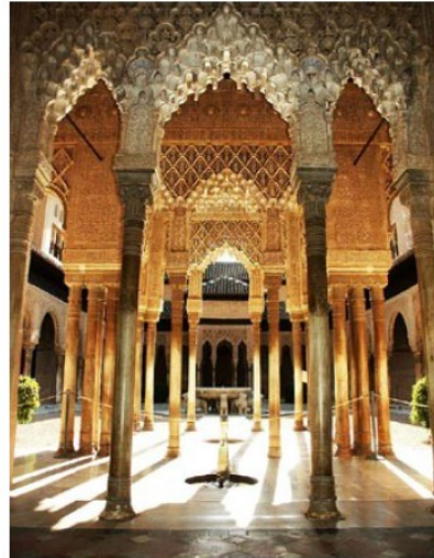
Alhambra de Grenade, Espagne