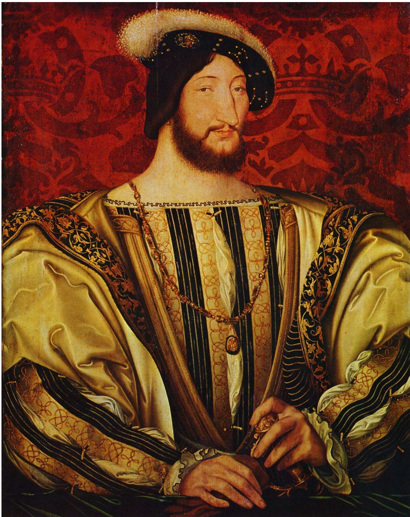
François 1 er peint par F. Clouet, 1525