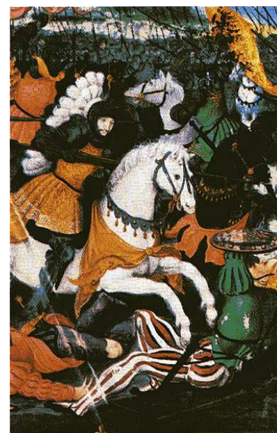
François 1 er à la bataille de Marignan 1515