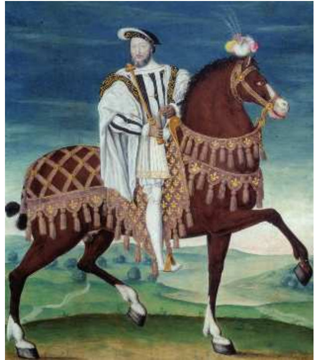
François 1 er à cheval, tableau de François Clouet, 1540