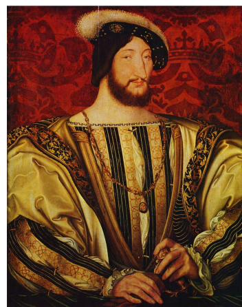
François 1 er peint par F. Clouet, 1525

Mécène : désigne un homme riche et/ou puissant qui aide artistes, savants et hommes de lettres financièrement.