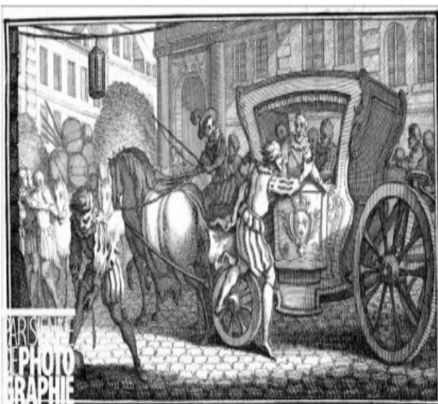
Henri IV est assassiné par Ravallac.

Henri IV est un roi très populaire qui se soucie du bien être de la population du royaume. Il est assassiné le 14 mai 1610 par François Ravallac.