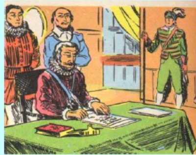
Henri IV signe l'édit de Nantes d'un manuel scolaire de 1968)