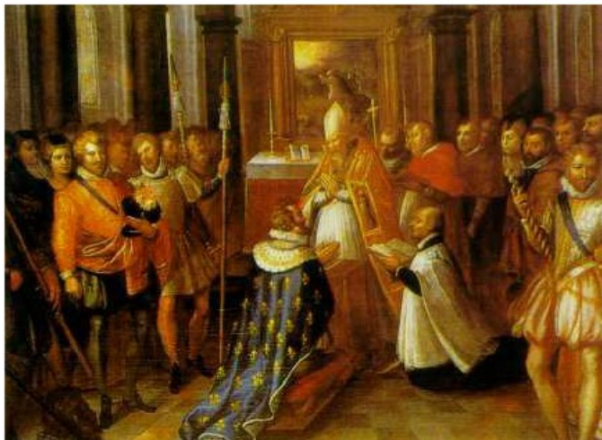
Henri IV se convertit au catholicisme. 1593.

En 1598, les guerres de religion se terminent par l'Édit de Nantes.